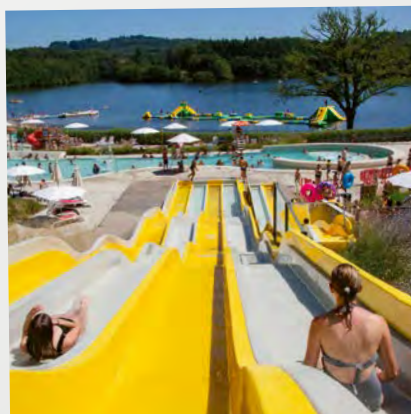
LAC DE SAINT-PARDOUX