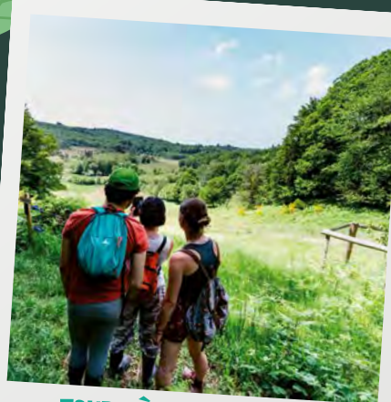
TOURBIÈRE DES DAUGES

UNE VUE IMPRENABLE ET UNE NATURE SAUVAGE