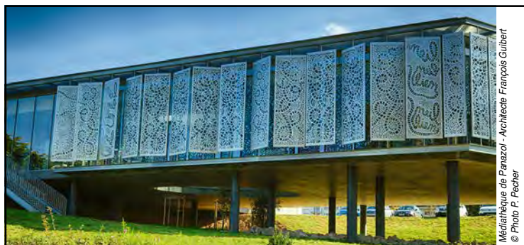
Médiathèque de Panazol - Architecte François Guilbert

1 chèque de 300 € à valoir sur 1 stage ou sur 1 séjour du catalogue 2026 (à gagner par tirage au sort)